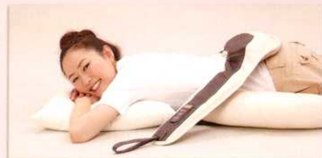
☆こんな使い方もできます。

コッタ部位に載せるだけで気持ち良いポイント・マッサージができます。骨等を避けたソレノイドの配置により気持ち良いマッサージが可能です。