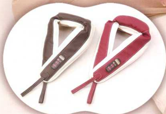
★ホワイト&ブラウン KT1MTAWB